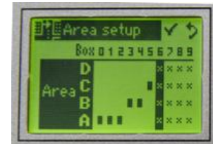
Attribution pour chaque boîtier de sa zone de travail