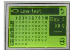
Test de lignes , Test accus, test Haute tension